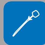
sigillo di sicurezza