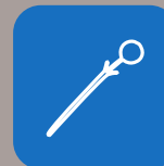
sigillo di sicurezza